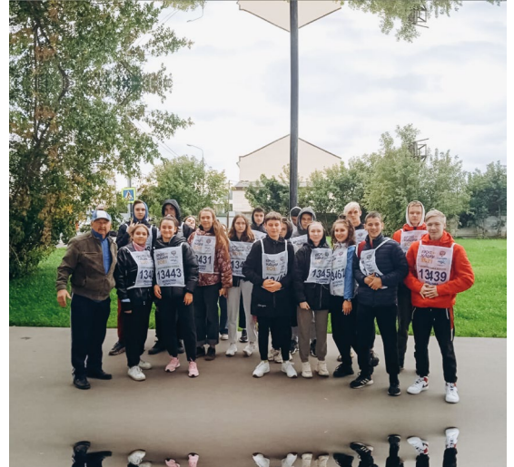
Члены отряда участвуют в Кроссе Наций 2021