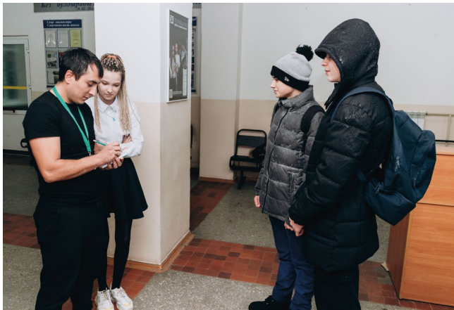
Вместе с администрацией проводят рейд «Первый звонок»