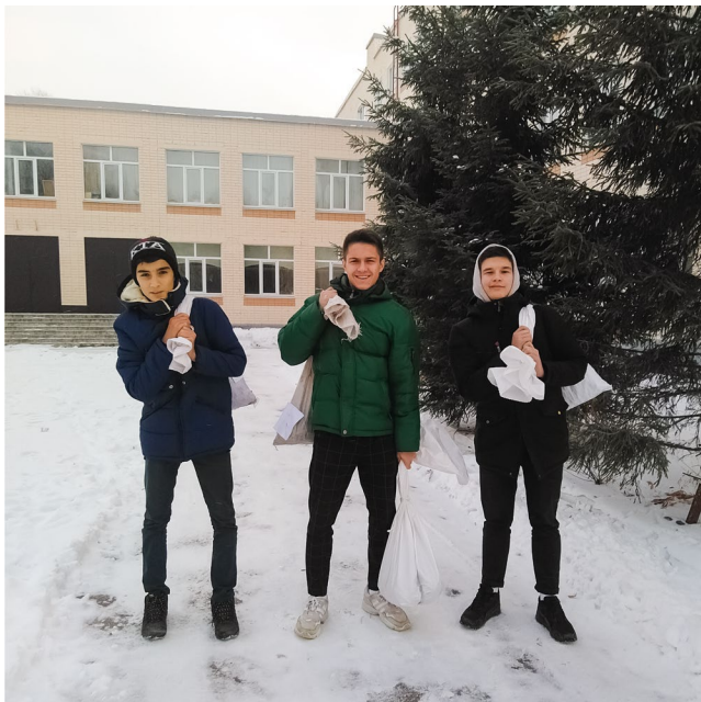
Сбор и сдача батареек