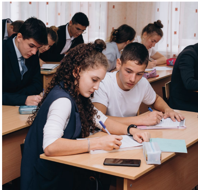
Татарча диктант - 2021