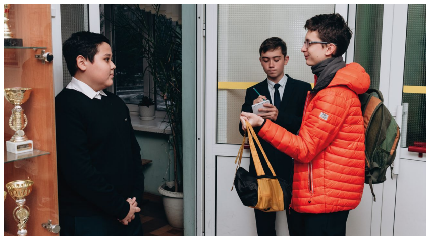
Рейд «Вторая обувь»