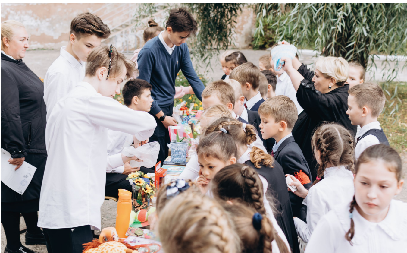
Осенняя Ярмарка Добра 2021