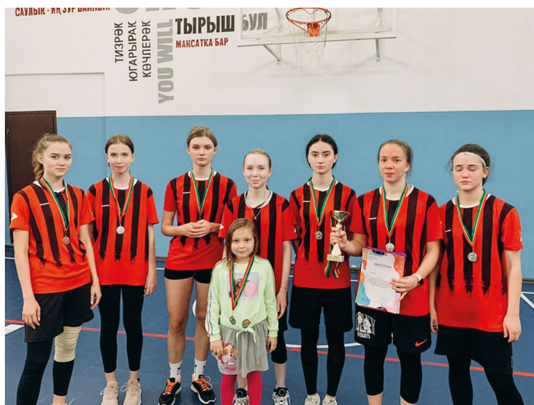
Команда девушек заняла 2 место в районных соревнованиях по баскетболу (2021)