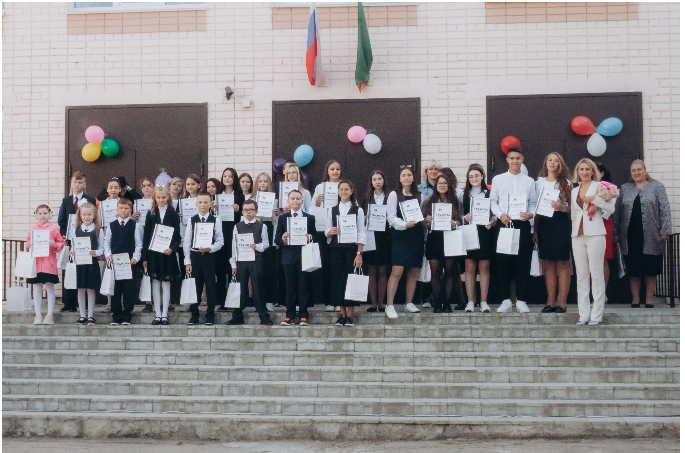
Награждение самых активных членов отряда по результатам 2020-2021 учебного года на торжественной линейке 1 сентября («Созвездие талантов»)