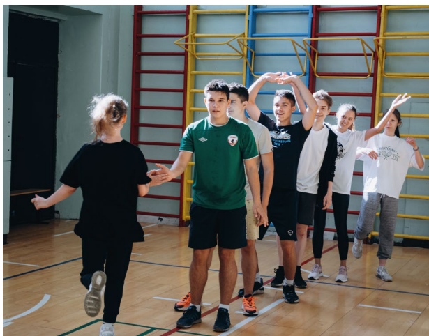
Эстафета ко Дню без вредных привычек