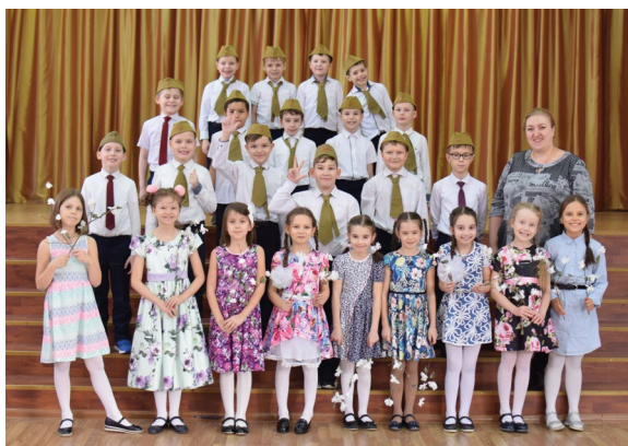
Ежегодное мероприятие, проводимое отрядом: Конкурс военно-патриотической песни для учащихся 1-4 классов

Взаимодействовать с Комитетом по делам детей и молодёжи, спорту и туризму в организации массовых мероприятий, вовлечение учащихся школы в их проведение.