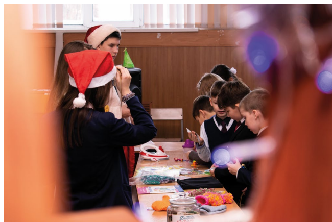
Зимняя Ярмарка Добра(2020)