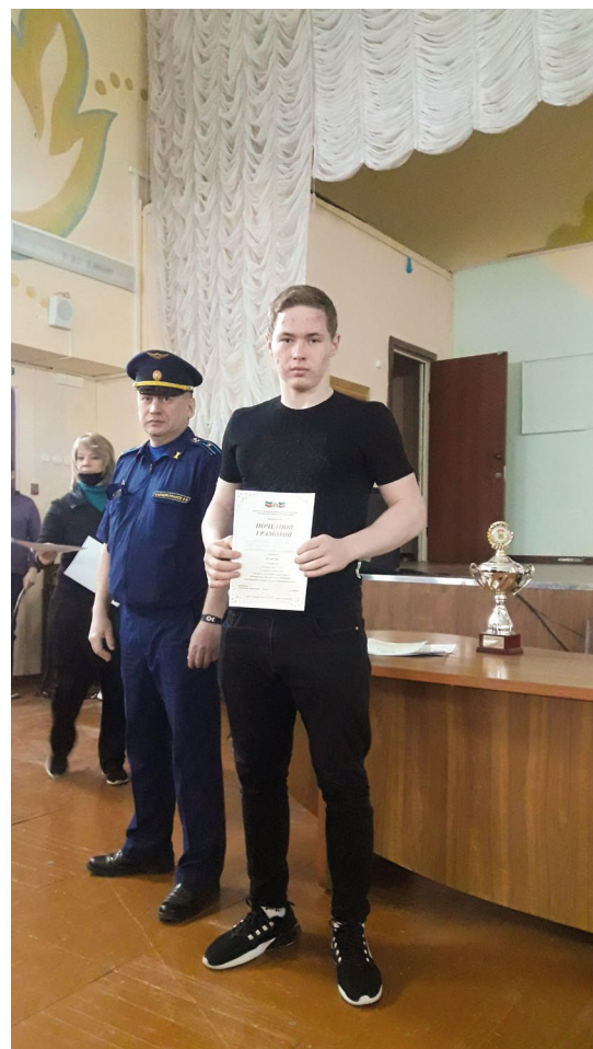
2 место на городской спартакиаде по военно-прикладным видам спорта (гирия) (2020)