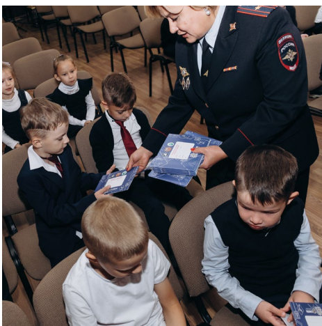
Урок для первоклассников по безопасности на дороге