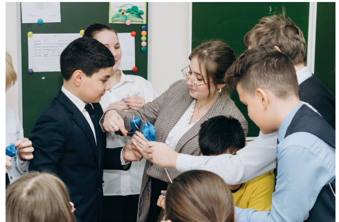
Мастер-класс ко Дню матери