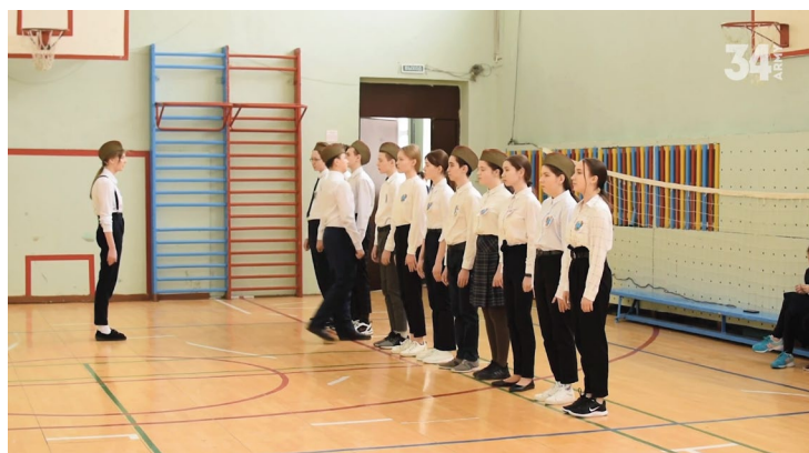
Ежегодное мероприятие, проводимое при содействии отряда: Смотр строя и песни для учащихся 5-11 классов