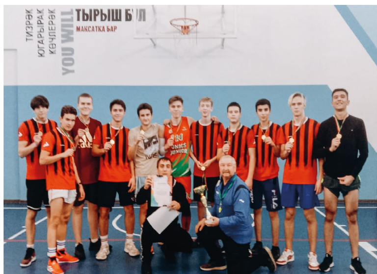
Команда Юношей заняла 1 место в районных соревнованиях по баскетболу (2021)