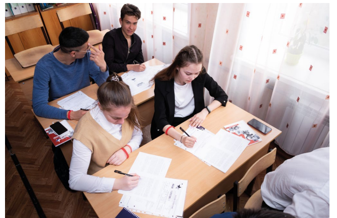
Диктант Победы 2021